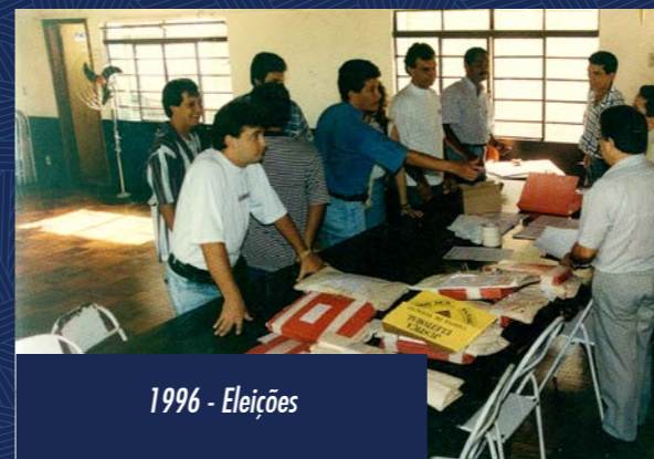
1996 - Eleições