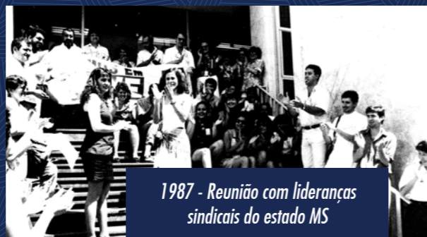
1987 - Reunião com lideranças sindicais do estado MS