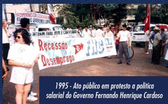
1995 - Ato público em protesto a política salarial do Governo Fernando Henrique Cardoso