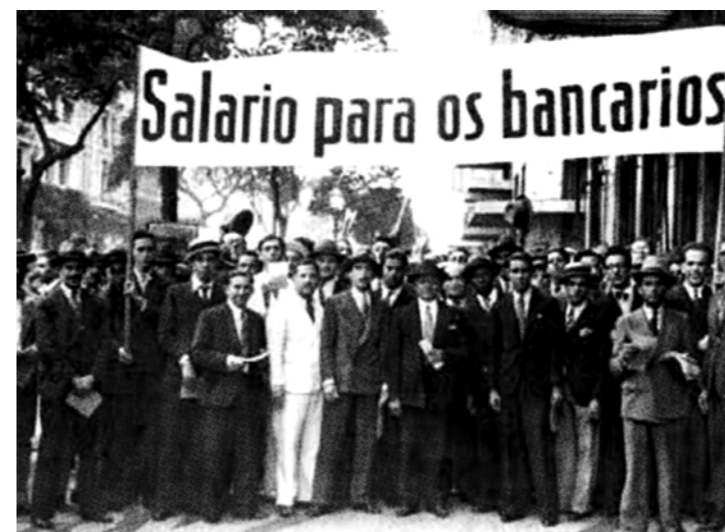
1932 - Os bancários de Santos (SP), deflagram uma greve.

Nessa nova conjuntura política e econômica o sindicalismo bancário ganhou força e representatividade. Tanto que em 1932 os bancários de Santos (SP), deflagraram uma greve que, aos poucos, migrou para a capital paulista e outras cidades do estado. Entre as reivindicações do movimento paredistas quatro se destacavam: