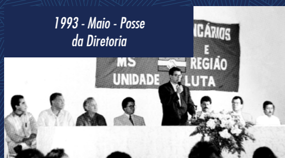
1993 - Maio - Posse da Diretoria