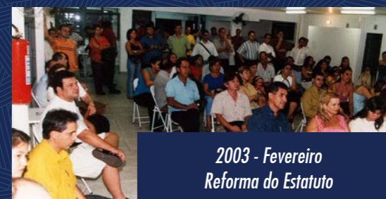
2003 - Fevereiro Reforma do Estatuto