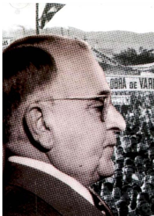
Getúlio Vargas, um dos principais articuladores da Revolução de 30.

O País, depois de 1930, mesmo sendo dirigido por um governo considerado ditatorial caminhou na direção da industrialização e permitiu que novas práticas sociais e políticas fossem incorporadas a vida da Nação (Neto, 2007).