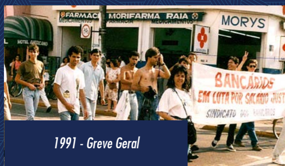
1991 - Greve Geral