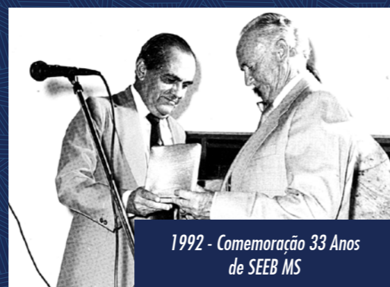
1992 - Comemoração 33 Anos de SEEB MS