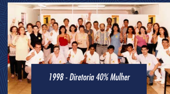
1998 - Diretoria 40% Mulher