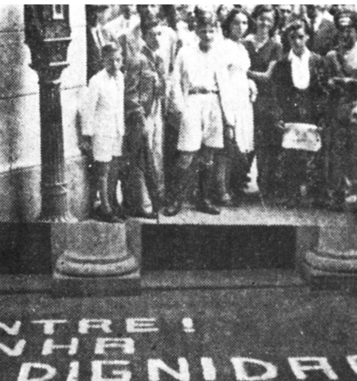
1946: Após o fim do Estado Novo e a eleição de Dutra para a Presidência, estouraram greves no país.

Em 1945, com a derrota do nazi/fascismo no mundo, os ventos da democracia chegaram ao Brasil. Em 1944 centenas de lideranças sindicais e políticas que estavam presas por supostamente terem lutado contra o Chamado Estado Novo ou terem participado do episódio de 1935, conhecido como Revolução de 1935, foram anistiadas o que representou um aporte importante para o movimento popular, pois, na sua maioria, eram homens e mulheres experimentados nas lides políticas. (Silva, Eronildo, 2005).