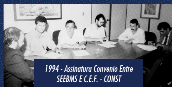
1994 - Assinatura Convenio Entre SEEBMS E C.E.F. - CONST