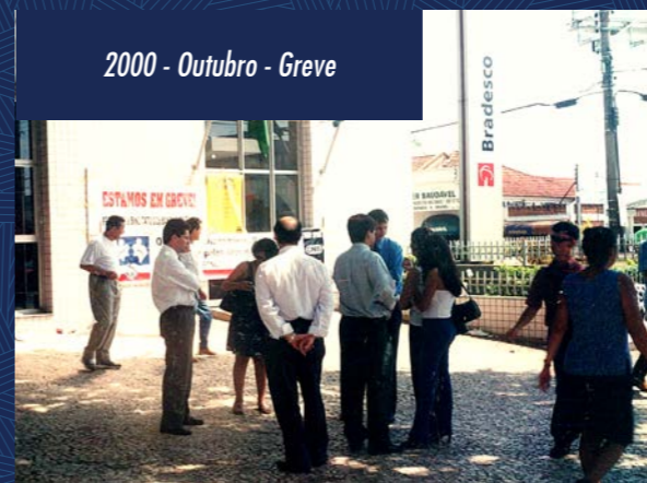
2000 - Outubro - Greve