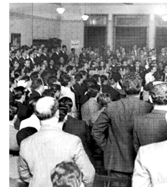
1933 - A categoria conquista a jornada de seis horas.

Como produto do aprendizado coletivo e das lutas, em 1933, os bancários paulistas conquistaram a carga horária de 36 horas e a mudança de nome da entidade, que em função da nova Legislação Trabalhista Brasileira, a Associação dos Bancários passou a se chamar Sindicato dos Bancários de São Paulo. (Fontes: Macedo; Sanches, 2013).