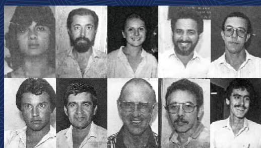
1986 - Chapa Única - Componentes