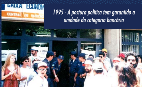
1995 - A postura política tem garantido a unidade da categoria bancária