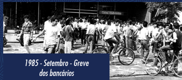
1985 - Setembro - Greve dos bancários